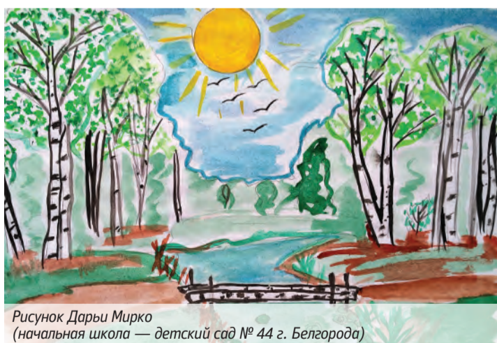
Рисунок Дарьи Мирко (начальная школа — детский сад № 44 г. Белгорода)