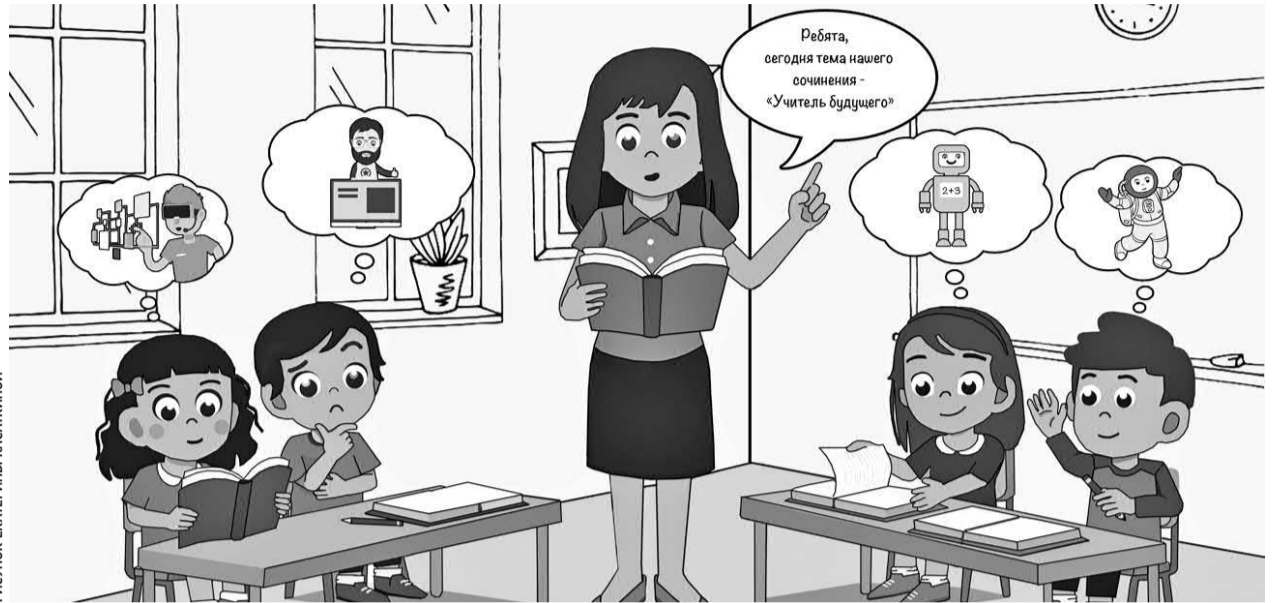
РИСУНОК ЕКАТЕРИНЫ КАСАКИНОЙ

Общая сумма выделенных средств — 10 млн рублей. Из них федеральное финансирование — около 8,5 млн. Почти 1,4 млн —