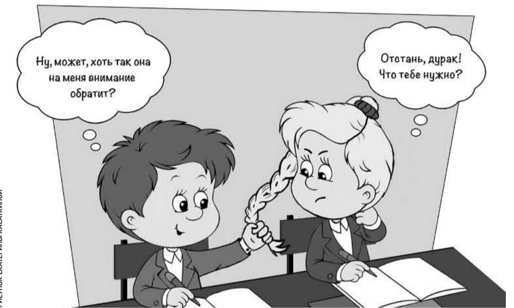
РИСУНОК ЕКАТЕРИНЫ КАСАКИНОЙ

Наши подростки переживают чувства влюблённости, первой любви, дружбы — это прекрасные человеческие чувства и отношения,