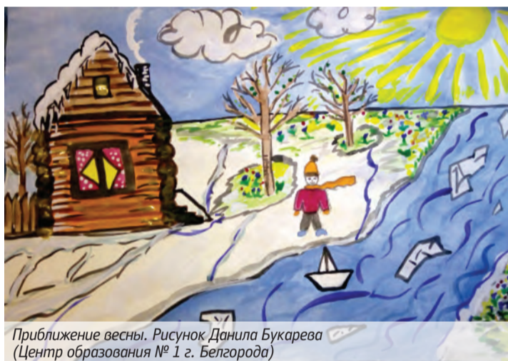
Приближение весны. Рисунок Даниила Букарева (Центр образования № 1 г. Белгорода)