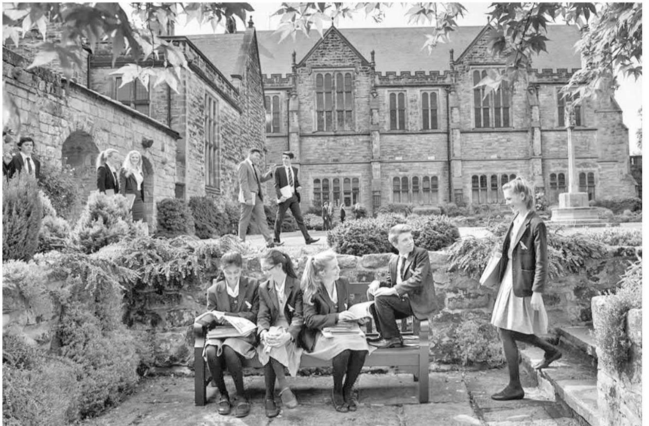
В некоторых канадских школах от формы и не думали отказываться