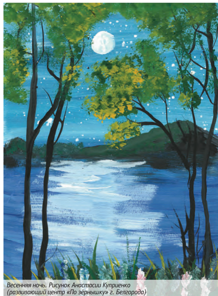
Весенняя ночь. Рисунок Анастасии Куприенко (развивающий центр «По зёрнышку» г. Белгорода)