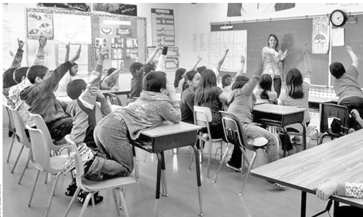
Занятия в одной из канадских школ